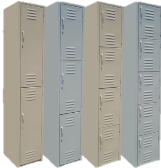
LOCKERS DE LINEA